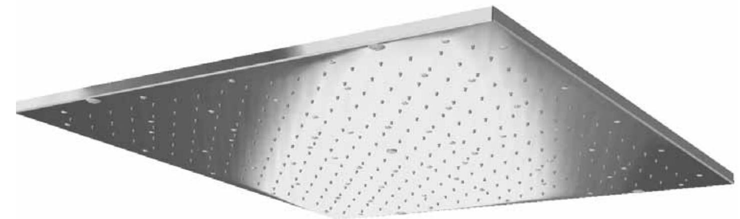
Doccia Scozzese esemplare installato presso una BeautyFarm di Pantigliate (MI). Doccia Scozzese showerhead installed in a Beauty-farm of Pantigliate (MI).

The rotation of hot to cold water jet stimulates the blood circulation giving you a relaxing sensation and acting as a gym for the muscular tissues.