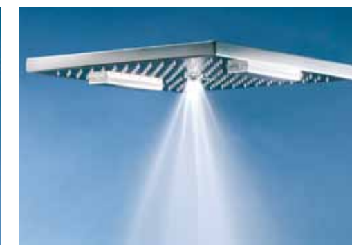
getto nebulizzato • atomised jet jet vaporisé • función nebulizado