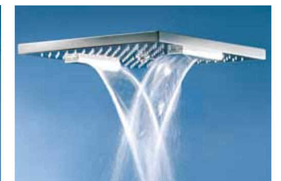
getto cascata • cascade jet jet cascade • función cascadas