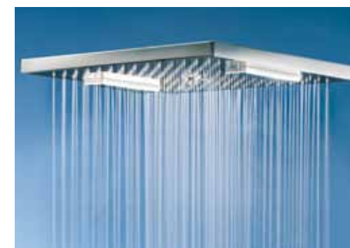
getto pioggia • rain jet jet pluie • función lluvia