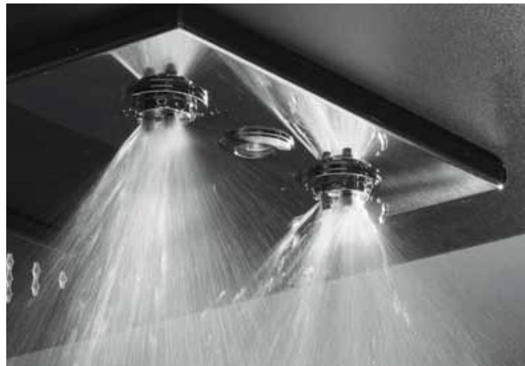
getto nebulizzato • atomised jet • jet vaporisé • función nebulizado