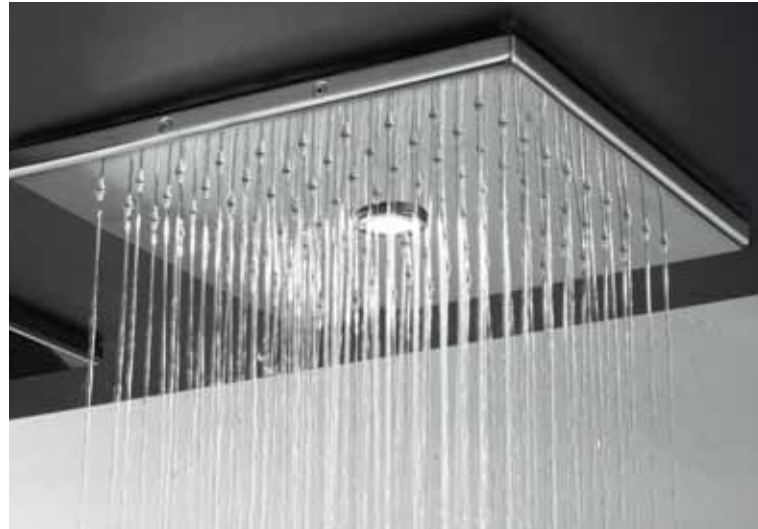
getto pioggia • rain jet • jet pluie • función lluvia