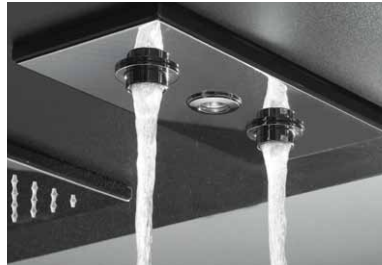
getto aerato • Aerated jet • jet aéré • función gaseosa