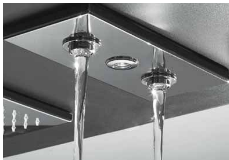
getto laminare • Laminar jet • jet laminaire • función laminar

Kit per Cromoterapia interna composto di Pulsantiera Waterproof con tasti a led blu, faretti RGB, trasformatore 24V e cavi di collegamento. Cromotherapy kit composed by waterproof push-button panel with buttons blue LED, RGB light sources, 24V feeder and connecting cables. Cromotherapie Kit composé par waterproof Bouton-poussoir avec LED bleu boutons, RGB sources lumineuses, alimentateur 24V et câbles de connexion. Kit Cromoterapia integrado por pulsador a prueba de agua con botones LED azul, RGB fuentes luminosas, alimentator 24V y cables de conexión.