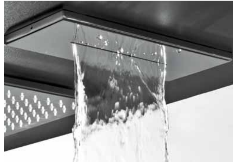
getto cascata • Blade jet • jet cascade • función cascada