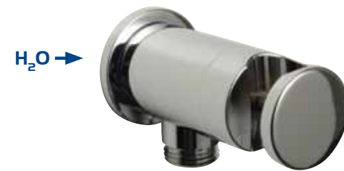
AUTOMATIC STOP WATER VALVE

Toma de agua redonda de latón cromado, con soporte ducha.