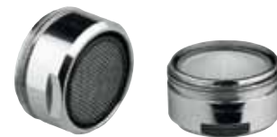
AE 43050 - 24x1 M AE 43051 - 22x1 F AE 43052 - 28x1 M