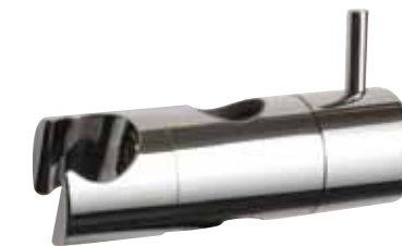
SC 32021 - Ø 20 mm SC 32020 - Ø 18 mm

Portaspone. Soap-dish. Porte-savon. Jabonera.