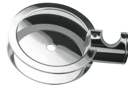
PO 33594 - Ø 18 mm PO 33635 - Ø 20 mm

Raccordo acqua in ottone cromato. Water connection elbow, in chromed brass. Prise d'eau en laiton chromé. Toma de agua de latón cromado.