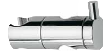
SC 33557 - Ø 18 mm SC 33634 - Ø 20 mm

Divine Scorsoio quadro in ottone cromato. Divine Squared sliding device, chromed brass. Divine Curseur carré, laiton chromé. Divine Soporte deslizante cuadrado, latón cromado.