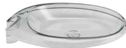
PO 32155 - Ø 20 mm PO 32156 - Ø 24 mm

CHALLENGE portaspone in ottone cromato. CHALLENGE soap-dish in chromed brass. CHALLENGE porte-savon en laiton chromé. CHALLENGE jabonera de latón cromado.