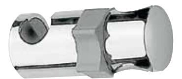
SC 33480 - Ø 20 mm SC 33481 - Ø 24 mm

Scorsoio in ABS cromato per rampe doccia. Sliding device, chromed ABS. Curseur en ABS chromé pour rampes douche. Soporte deslizante de ABS cromado para barras ducha.