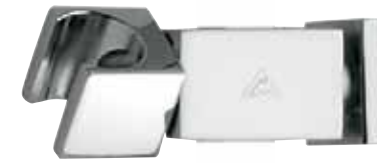
SC 33043 - □ 15 mm SC 33042 - □ 18 mm

Raccordo acqua in ABS cromato. Water connection elbow, in chromed ABS. Prise d'eau en ABS chromé. Toma de agua de ABS cromado.